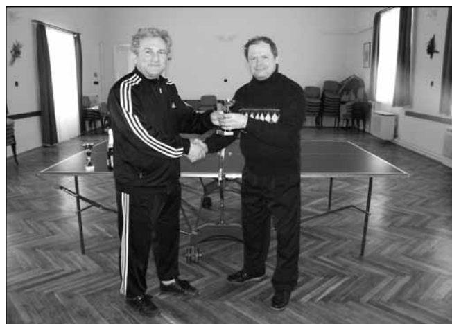
Nostalgia Kupa asztalitenisz verseny díjátadása