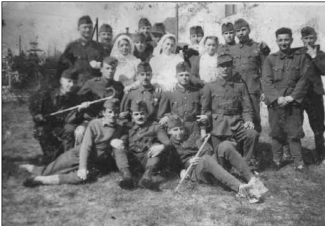
A 2. magyar hadsereg katonái abban a tudatban mentek a frontra, hogy hamarosan hazatérhetnek

Január 24-én a 2. hadsereg maradványai is kiváltak az arconalból. Jány ekkor adta ki a katonákat súlyosan sértő, „A 2. Magyar hadsereg elvesztette a becsületét” mondattal kezdődő parancsát. A katasztrófa mélyebb okait ekkor még nem látta