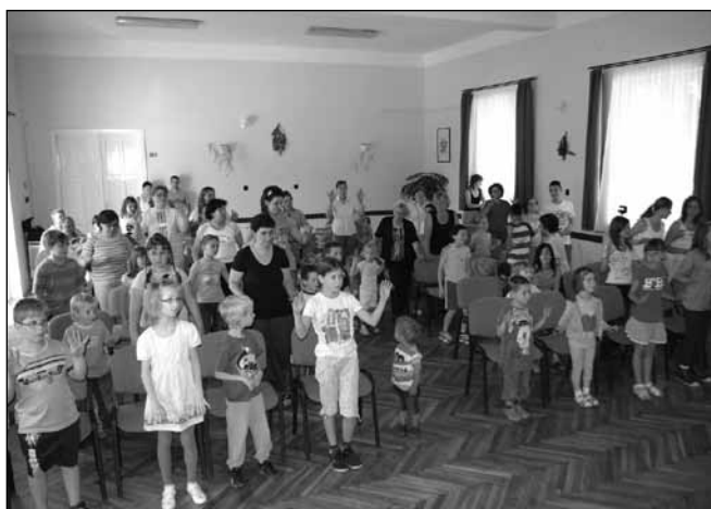
Gyereknep a Művelődési Házban