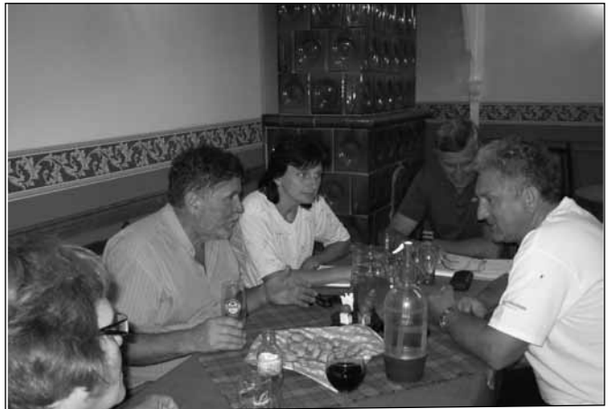
Ülésezik az elnökség