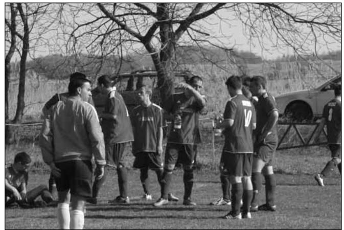
A csapategységre lehet építeni az eredményes szereplést

A TAO pályázatnak, Kápolnáért Kulturális és Sport Egyesületnek, Sitke Község Önkormányzatának köszönhetően a tavaszi rajtot megszépült öltözővel, új sportfelszereléssel gazda-