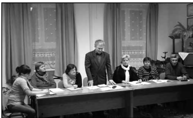
Csak összefogással van esély a falu továbbfejlesztésére

– Én mindig azt mondom, a mi életünket olyan nagyban a változás nem érinti. Az ügyfélfogadási idő is ugyanúgy marad, mint eddig. Járási ügygondnokot sem kértünk, mert nekünk ez nem volt létkérdés.